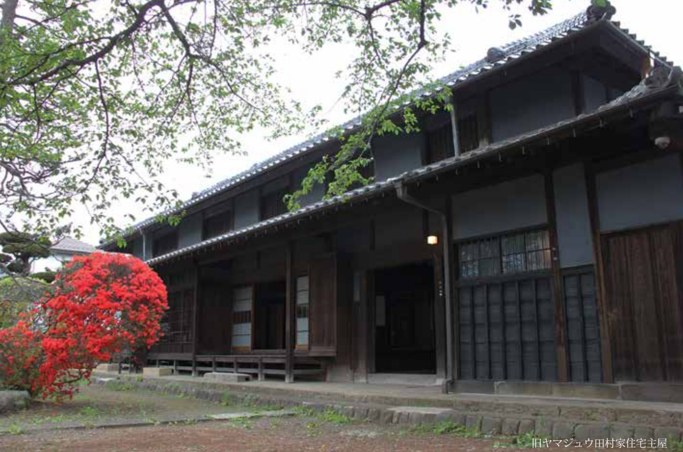
旧ヤマジユウ田村家住宅主屋