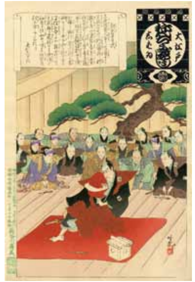
上 安達吟光「大江戸芝居年中行事」顔寄せの式 明治30年(1897) 中 安達吟光「大江戸芝居年中行事」披露目の口上 明治30年(1897) 下 豊原国周「早晚稲守田当秋」明治2年(1869)